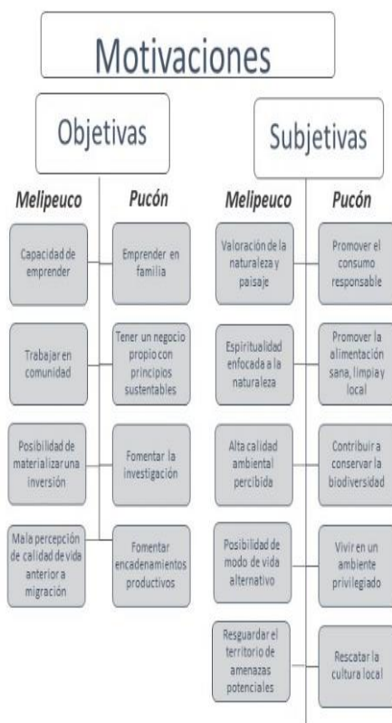
Figura 2. Esquema de motivaciones según clasificación propuesta por Nogué

La Figura 2 muestra una clasificación de las motivaciones más mencionadas por los entrevistados que permitieron la creación de los perfiles de migrantes que se describen a continuación para ambas comunas.